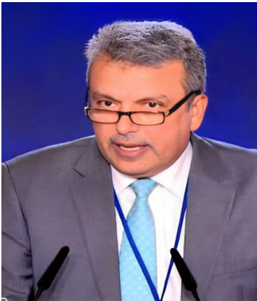
الدكتور عيد النعيمات - نائب و كاتب أردني

لهذا الواجب الأخلاقي والإسلامي والإنساني ونحن في الأردن نعد فلسطين صنو الأردن ونرى أن القتال والصمود الفلسطيني هو دفاعاً عن الشرف العربي