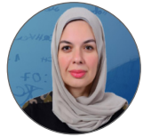
د. أميرة جبارير

"أقنعة الافتعال"، "إنهناك معنوي"، "مهارات استعراضية وارتدائه"، "مطأطأ الرأس"، "ممثل يعلو سلوكه ومحياه" الحيل الماكرة والخداع المفضوح، في حالة هزيمة واعتذار وحرص وانكسار، وتلك عادة خريج كلية الهندسة لكن عند رئيس وزراء الاحتلال له رؤية منفردة لشخصيته، فيؤمن دائماً بذكائه الذاتي، وتعد تلك الصفة من الطباع النزجسية، وبالتالي لا يتردد في استغلال الآخرين لمكاسبه الشخصية والسياسية، فطابعه الهندسي دائماً ما يغريه أنه قادر على فهم واستيعاب وتحليل أي شيء حتى لو كان من خارج كادره.